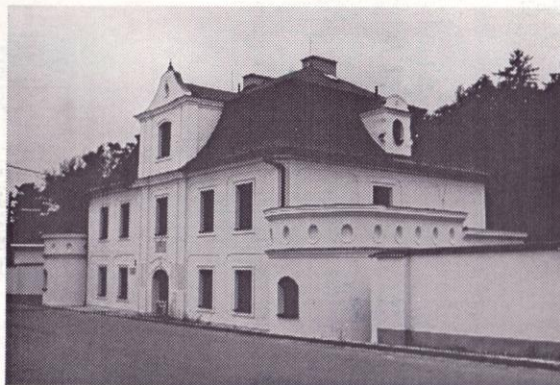
Dittersův dům - Javorník