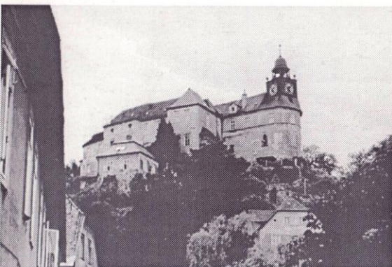
zámek Jánský Vrch - Javorník